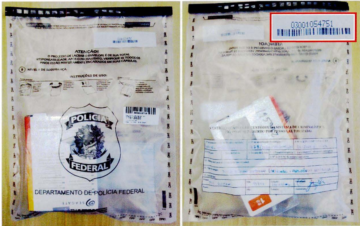
Figura 1: Material questionado acondicionado em envelope de segurança padrão PF nº 03001054751. Frente (esquerda) e verso(direita).

Criminalística como Material Nº 779/2020 – INC/DITEC/PF , da marca SEAGATE , modelo EXPANSION , número de série NA88DDP3 , patrimônio da Presidência da Republica nº 195.1992 . O material é apresentado nas Figuras 1 e 2.